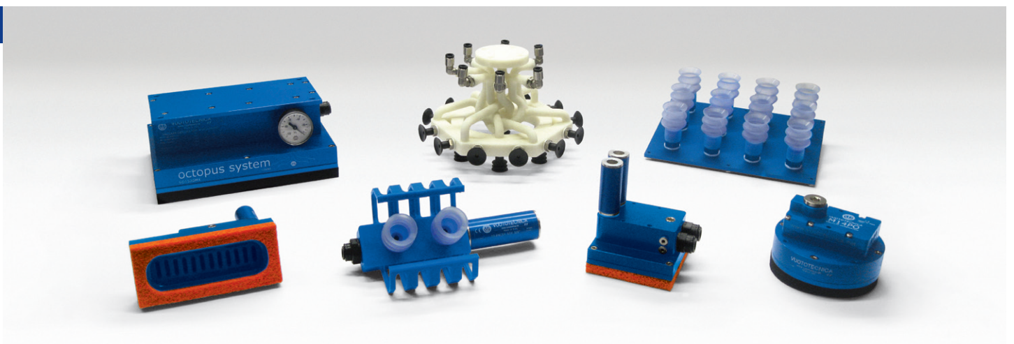
SISTEMA DI PRESA A DEPRESSIONE OCTOPUS | OCTOPUS VACUUM GRIPPING SYSTEM | SYSTÈME DE PRÉHENSION PAR DÉPRESSION OCTOPUS | VAKUUMGREIFSYSTEME "OCTOPUS" | SISTEMA DE AGARRE POR VACÍO OCTOPUS