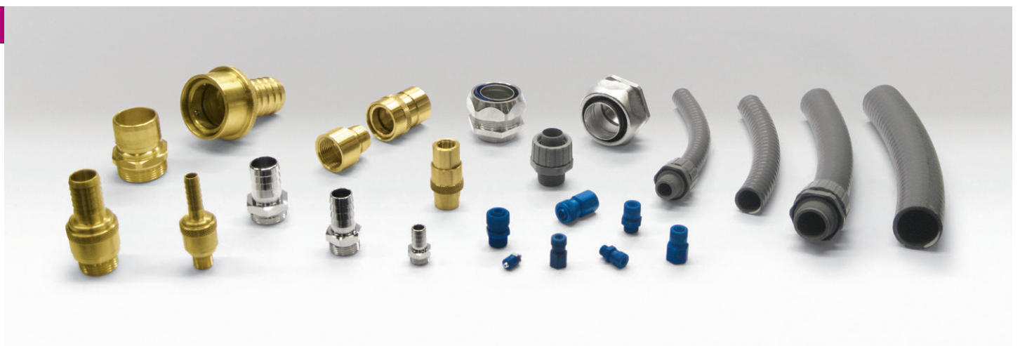
RACCORDERIA E TUBAZIONI PER IL VUOTO | VACUUM FITTINGS AND HOSES | RACCORDS ET TUYAUTERIES POUR LE VIDE | VAKUUMANSCHLÜSSE UND -SCHLÄUCHE | RACORES Y TUBOS PARA VACÍO