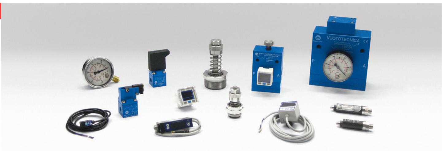
STRUMENTI DI MISURA, DI CONTROLLO E DI REGOLAZIONE DEL VUOTO | VACUUM MEASUREMENT, CONTROL AND ADJUSTMENT INSTRUMENTS | INSTRUMENTS DE MESURE, DE CONTRÔLE ET DE RÉGULATION DU VIDE | INSTRUMENTE ZUM MESSEN, KONTROLLIEREN UND REGULIEREN DES VAKUUMS | INSTRUMENTOS DE MEDICIÓN, CONTROL Y REGULACIÓN DE VACÍO