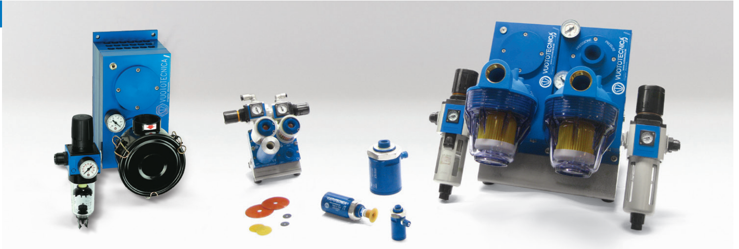
GRAPHIC DIVISION | GRAPHIC DIVISION | DIVISION GRAPHIQUE | GRAPHIC DIVISION | GRAPHIC DIVISION