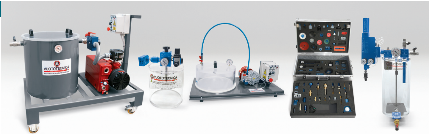
ESECUZIONI SPECIALI | SPECIAL PRODUCTS | EXÉCUTION SPÉCIALE | SPEZIALAUSFÜHRUNGEN | EJECUCIONES ESPECIALES