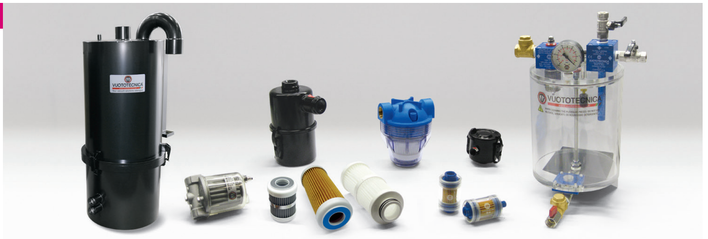
FILTRI D'ASPIRAZIONE | SUCTION FILTERS | FILTRES D'ASPIRATION | VAKUUMFILTER | FILTROS DE ASPIRACIÓN