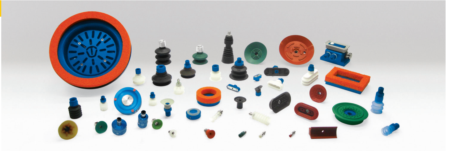
VENTOSE | VACUUM CUPS | VENTOUSES | SAUGGREIFER | VENTOSAS