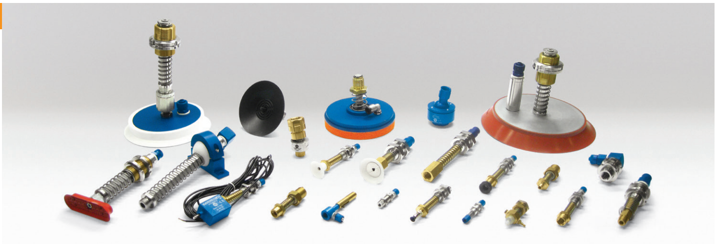
PORTAVENTOSE | VACUUM CUP HOLDERS | PORTE-VENTOUSES | SAUGGREIFERTRÄGER | PORTAVENTOSAS