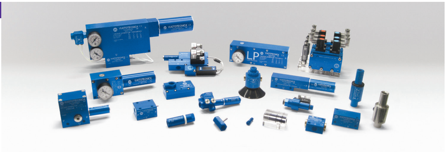
GENERATORI DI VUOTO E DEPRESSORI PNEUMATICI | VACUUM GENERATORS AND PNEUMATIC PUMPSETS | GÉNÉRATEURS DE VIDE ET CENTRALES DE VIDE PNEUMATIQUES | PNEUMATISCHE VAKUUMERZEUGER UND VAKUUMPUMPSYSTEME | GENERADORES DE VACÍO Y DEPRESORES NEUMÁTICOS